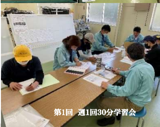
第1回 週1回30分学習会