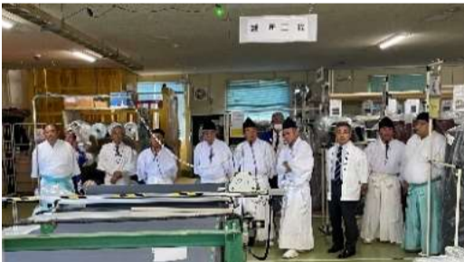
地域の神様(皆様)の工場見学