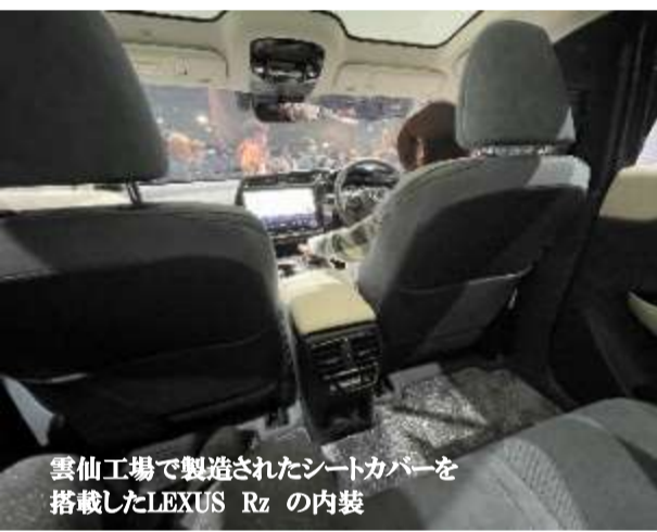
雲仙工場で製造されたシートカバーを搭載したLEXUS RZの内装

中でもその主役はトヨタ自動車。トヨタ・レクサスブースは、大盛況です。将来の方向を示すコンセプト車がズラリと展示され他社を圧倒している状況でした。レクサスブースには、雲仙工場のみで製造しているシートカバーを搭載したレクサスRZの展示もありました。現物の車両を見るのは初めてで大興奮。日頃シートカバーと実際に乗っているものの、実際に乗り込みその姿を目の当たりにすると、雲仙工場の皆さんの顔が浮かび、熱いものがこみ上げて来たところでした。来場された100万人を超える人々に、雲仙工場の皆さんの努力の結晶を見てもうらやかと思うと、なんだか誇らしい気持ちになりました。