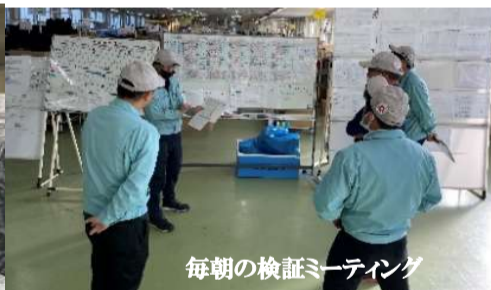
毎朝の検証ミーティング