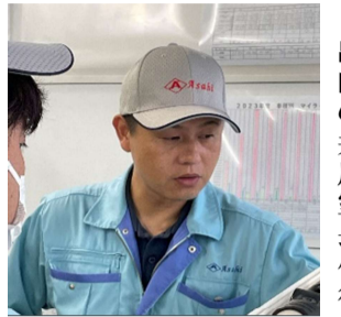
出向の井川室長代行