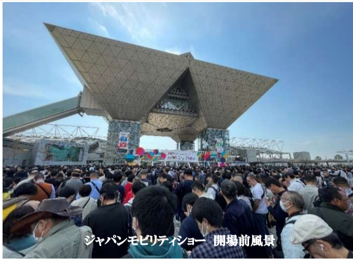
ジャパンモビリティショー 開場前風景