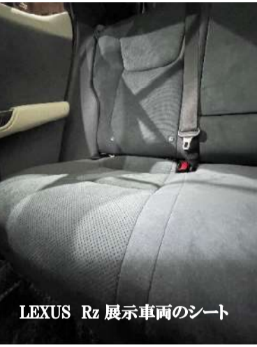
LEXUS RZ 展示車両のシート

10月27日から11月5日まで、東京ビッグサイトにおいて、ジャパン・モビリティショーが開催されました。これまでの東京モーターショーの名称が変更され4年ぶりの開催となりました。「乗りたい未来を探しに行こう!」をテーマに自動車各社をはじめ関連企業、自動車業界の枠を超えた他産業・団体が参加した。期間中の来場者はなんと111万人。自動車産業に対する関心の高さを示していました。我が国の自動車産業は550万人、モビリティ産業には850万人が働いているといわれています。これからのモビリティは、単なる移動手段ではなく「人を動かすモノを動かす」ことを動かす「もの」であり続けたいとのメッセージが発表されました。自動車産業の中で働くものとして感銘をしたところでありました。