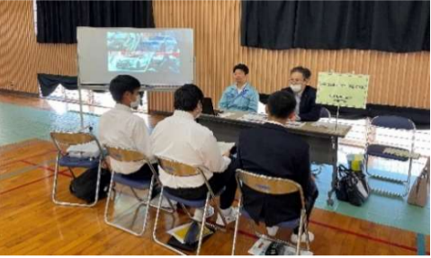
国見高校企業説明会