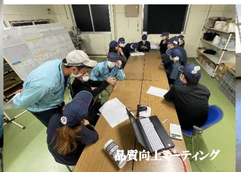
品質向上ミーティング