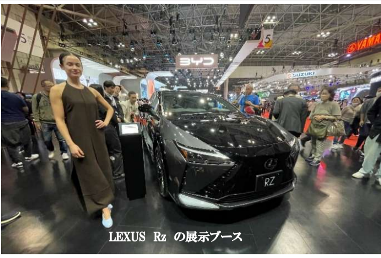
LEXUS RZ の展示ブース