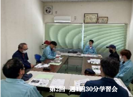
第2回 週1回30分学習会