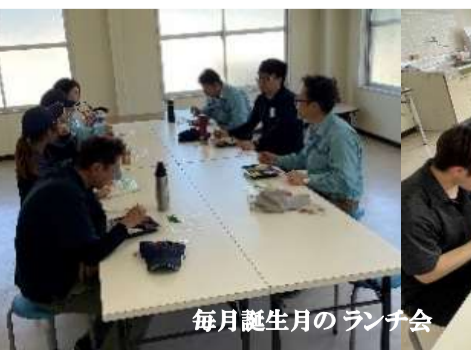
毎月誕生月のランチ会